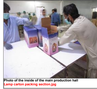
Photo of the inside of the main production hall Lamp carton packing section.jpg