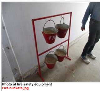
Photo of fire safety equipment Fire buckets.jpg