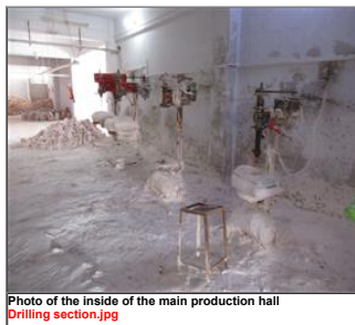
Photo of the inside of the main production hall Drilling section.jpg