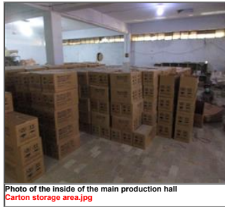
Photo of the inside of the main production hall Carton storage area.jpg