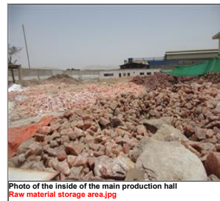
Photo of the inside of the main production hall Raw material storage area.jpg