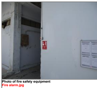
Photo of fire safety equipment Fire alarm.jpg