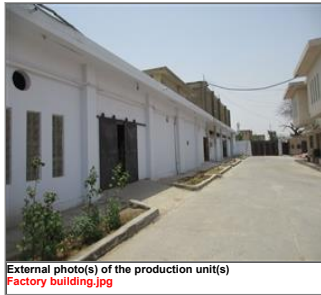
External photo(s) of the production unit(s) Factory building.jpg