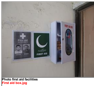
Photo first aid facilities First aid box.jpg