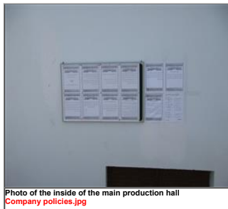
Photo of the inside of the main production hall Company policies.jpg