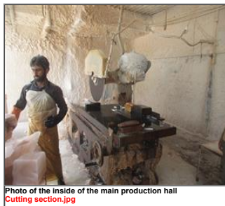
Photo of the inside of the main production hall Cutting section.jpg