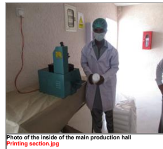
Photo of the inside of the main production hall Printing section.jpg