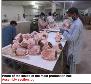
Photo of the inside of the main production hall Assembly section.jpg