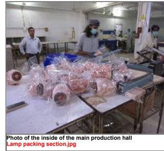
Photo of the inside of the main production hall Lamp packing section.jpg