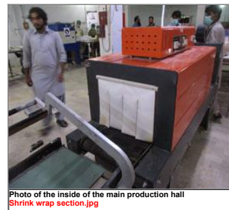
Photo of the inside of the main production hall Shrink wrap section.jpg